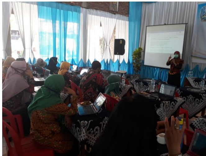
Gambar 2. Pelaksanaan Workshop dengan Dosen Pendidikan Matematika