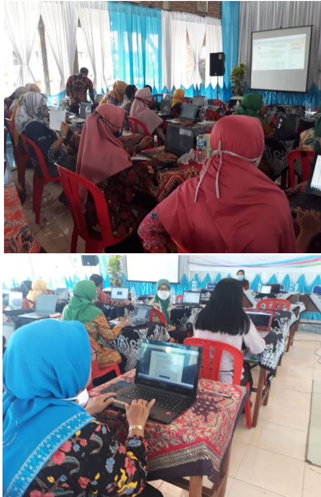
Gambar 5. Praktik Membuka Link Jurnal